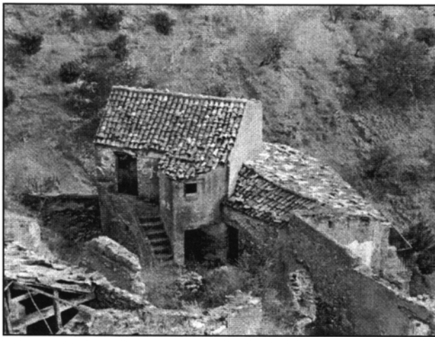
Architecture rurale calabraise

Les Calabrais sont très sensibles aux questions écologiques. Actuellement de grands débats ont lieu au sujet de la construction d'un pont entre Reggio et Messine.