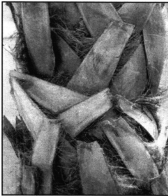
Palmiers au cœur tressé...

donc été amenée à beaucoup voyager dans ces régions. Je connaissais assez bien le Nord de l'Italie et Rome. Mais j'ai été particulièrement touchée et émue par la découverte de la Calabre, la variété de ses paysages, la présence conjugée de la mer et de la montagne m'ont séduite ainsi que la vie culturelle très particulière de cette région qui a subi des influences latines, grecques mais aussi normandes. C'est ainsi que je me suis prise d'affection pour ce pays situé à la pointe de l'extrême Sud de l'Europe.